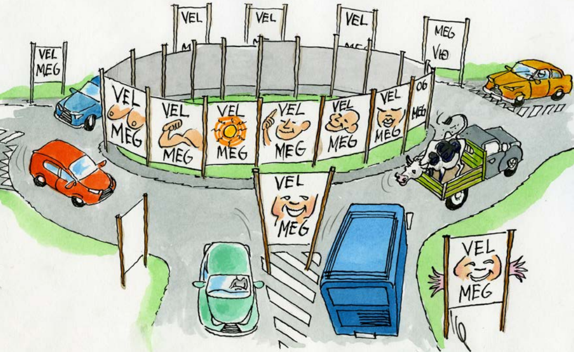
Valplakatir mugu ekki heingjast upp á rundkoyringum og ferðsluoyggjum